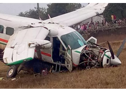
మంత్రి విభాజి భూషణ్ జెనా స్పందించారు. క్షతగాత్రుల పరిస్థితి నిలకడగా ఉందని తెలిపారు.

భువనేశ్వర్: ఒడిశాలోని రవుర్కెలా నుంచి భువనేశ్వర్ కు వెళ్తున్న చార్టర్డ్ ఫైట్ కలిసిపోయింది. రేకాట్ అయి 10 కిలోమీటర్ల ప్రయాణించిన తర్వాత అయితే నిఘలమవడంతో జలద వర్ష వంట పొలాల్లో పడిపోయింది. ఈ ఫుటనలో ఫైట్ లోకాపాటు ఆరుగురు గాయపడ్డారు. ఇందులో టెలగరు ప్రయాణికులు కాగా.. ఇద్దరు నిబ్బంది ఉన్నట్లు సమాచారం. క్షతగాత్రులను అనుచరికి తరలించి చికిత్స అందించారు. ఎవరీకి ప్రాణాపాయం లేకపోవడం అలా తుపి బీల్లుకున్నారు. ఫుటనపై ఒడిశా రవాణా శాఖ